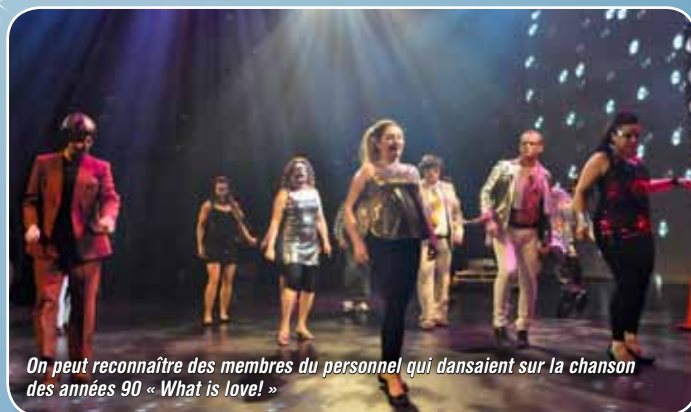
On peut reconnaître des membres du personnel qui dansaient sur la chanson des années 90 « What is love! »