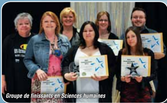
Groupe de finissants en Sciences humaines