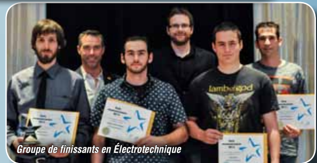
Groupe de finissants en Électrotechnique