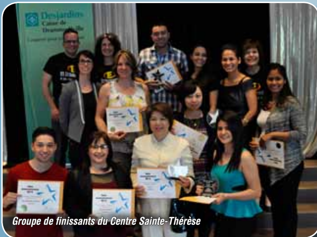
Groupe de finissants du Centre Sainte-Thérèse