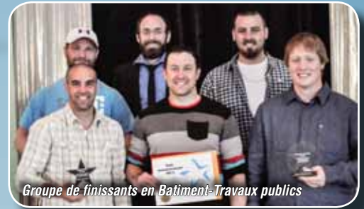
Groupe de finissants en Bâtiment-Travaux publics