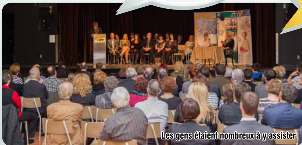
Les gens étaient nombreux à y assister

« Je me suis présenté notamment car je crois en la valeur ajoutée de notre commission scolaire dans le service aux élèves. Il ne s'agit pas de défendre une structure pour une structure, il s'agit de faire comprendre une fois pour toutes que ce palier est nécessaire. Je demande à tous les intervenants chez-nous de se liguer derrière nous, dans l'intérêt de tous. »