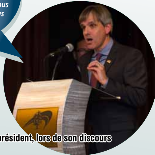
Le président, lors de son discours

« Je constate avec joie que je fais partie d'un groupe de 26 personnes qui ont décidé de briguer les suffrages dans le but de devenir membre du conseil des commissaires. Compte tenu du fond de l'air, le moins que l'on puisse dire, c'est que tous ces candidats et les élus qui sont devant vous ne pourront jamais être taxés d'opportunisme. »