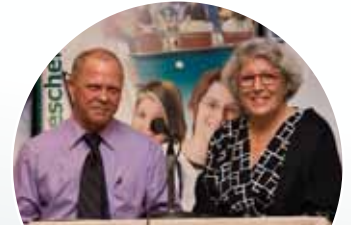
Gaetan Delage, commissaire circonscription 7