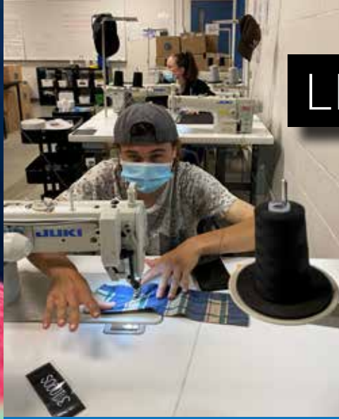
Élèves au local de dépersonnalisation (couture) Hydro-Québec