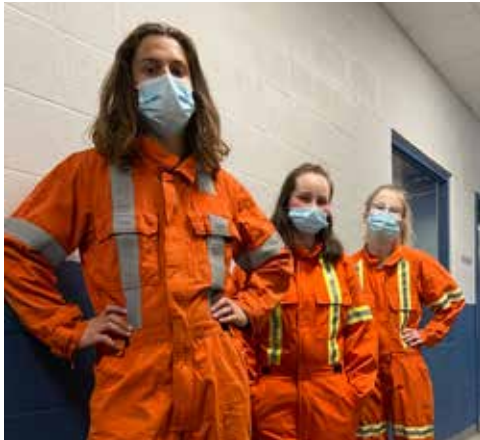
Élèves modèles pour les vêtements de protection à vendre

Afin d'ajouter de la valeur à la formation du CFER, déjà bien enrichie par la flexibilité de son programme, l'équipe a instauré les formations CFER PLUS. Ces formations sont offertes par différents formateurs du SAE Centre-du-Québec (Service aux entreprises) et l'élève qui répond aux exigences de réussite se voit remettre une carte de compétence recherchée sur le marché du travail. Cette année, une grande partie des élèves du CFER a suivi la formation de cariste (chariot élévateur), ASP construction et le cours d'Hygiène et salubrité.