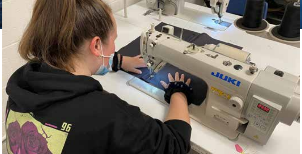
Élèves au local de dépersonnalisation (couture) Hydro-Québec

Les enseignants du CFER 3 ont réaménagé les horaires et multiplié les opportunités de stages pour les élèves qui passent maintenant trois jours par semaine au travail dans des commerces et entreprises de la région. Cela accroît grandement leurs expériences de travail. Il y aura 18 élèves en réussite pour leur certification ministérielle cette année, soit la plus grande cohorte de finissants depuis longtemps. De ces 18 élèves, 15 élèves auront la chance de poursuivre en emploi avec leur entreprise de stage.