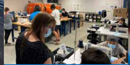
Local de dépersonnalisation (couture) Hydro-Québec

On se souviendra, le CFER des Chênes fut touché par l'incendie de son usine en janvier 2020 obligeant ainsi l'arrêt de la production de son usine et la scolarisation des élèves. Les membres du personnel ont ainsi dû faire face à une première relocalisation d'urgence dans les locaux du Centre de formation générale aux adultes Sainte-Thérèse afin de poursuivre l'enseignement.